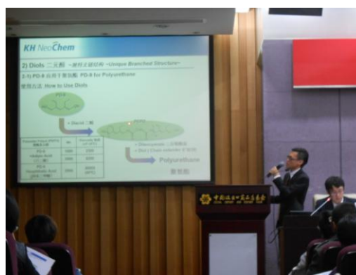
テクニカルセミナー