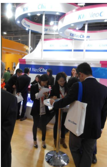
当社ブースの様子

期間中に開催したテクニカルセミナーでは、DAAM の最大の特徴である「一液自己架橋システム」など、DAAM の使用方法から、用途展開、応用技術紹介などのプレゼンテーションを行いました。また、ジオール製品群においても樹脂の性能を向上させる機能性材料として PR をして参りました。活発な質疑応答が行われ、多くのお客様から大変ご好評を頂きました。当社ブースにおいても高級アルコールや合成脂肪酸など、界面活性剤や潤滑油、樹脂原料として使用される特色ある機能性材料を紹介し、こちらも同様に多くのお客様からのお問い合わせを頂き、当社製品群へのご興味を持って頂きました。